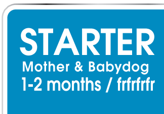
Мазер & Бебі Дог Стартер